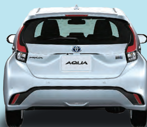
ボディカラーはシルバーメタリック(1F7)。