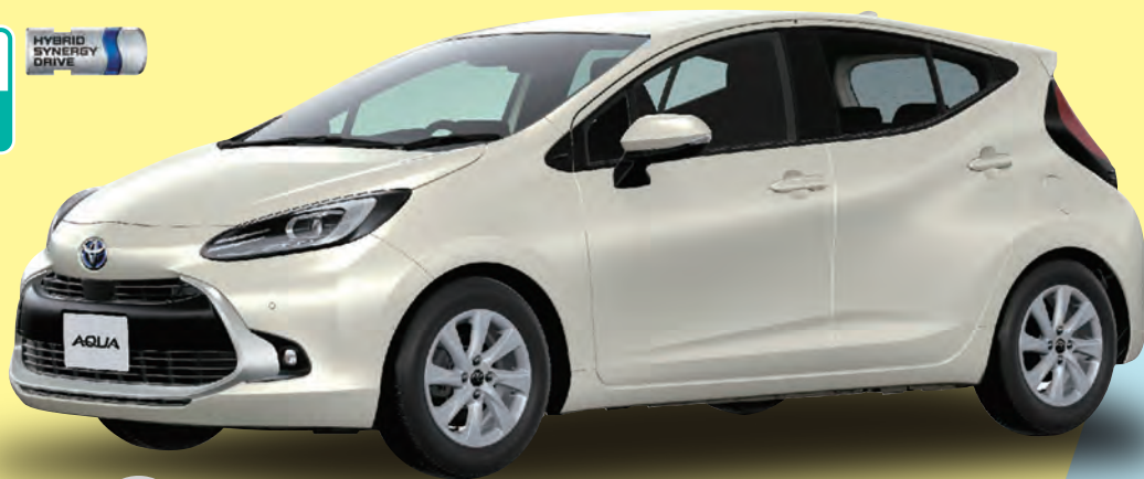
ボディカラーはクリアベージュメタリック(4Y3)。