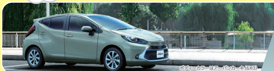
ボディカラーはアーバンカーキ(6X3)

※電気製品の消費電力は一般的な目安です。製品の種類や大きさなどにより消費電力は大きく異なる場合があります。また、立ち上がり時などは瞬間的に電力を大量に消費します。